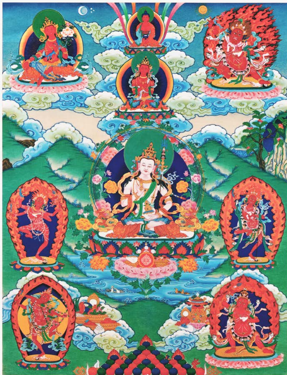
ДЕВЕТТЕ БОЖЕСТВА НА МАГНЕТИЗИРАЧКИ АКТИВНОСТИ